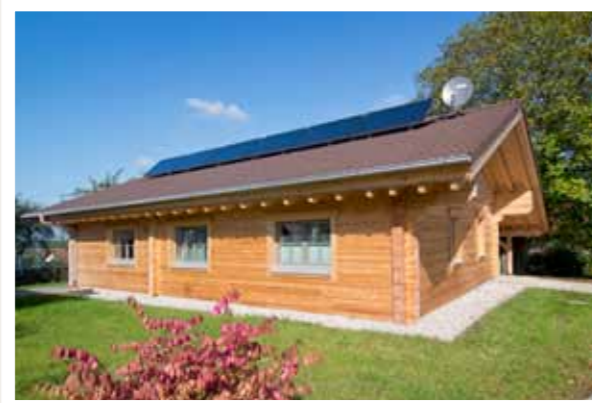
Die Fensterproportionen harmonisieren mit denen des Hauses.