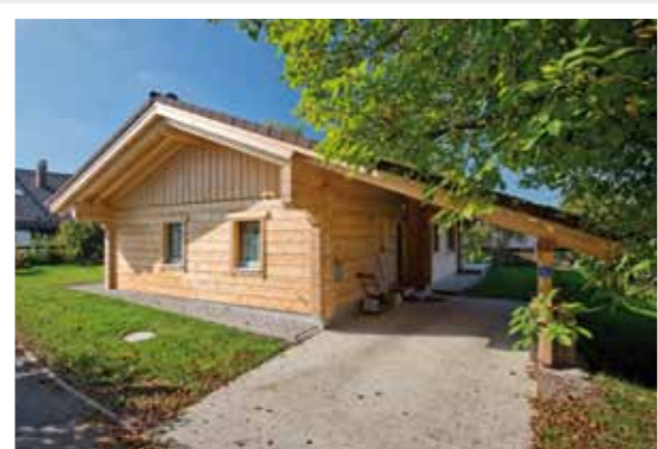
Das Schleppdach über dem Hauseingang ist gleichzeitig Carport.