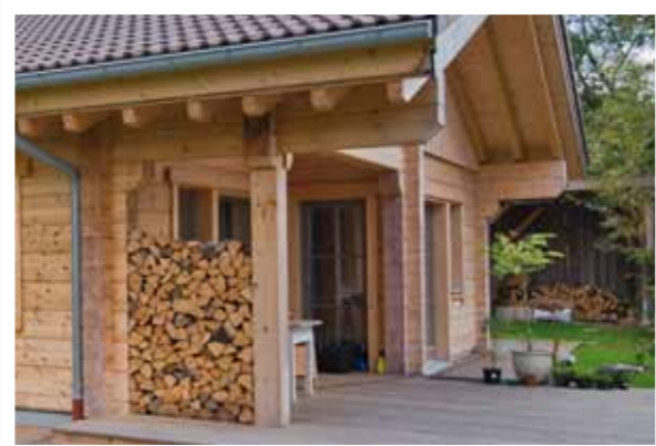
Eine dekorative Holzlege bietet Wind- und Sichtschutz.