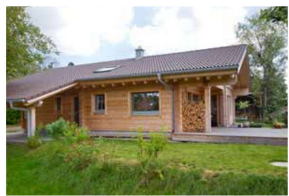
Die Holzsäulen von Carport und Terrasse passen perfekt zur massiven Kantholzbalkenkonstruktion.