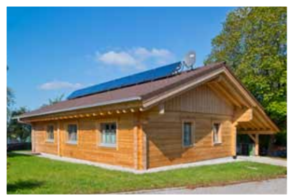
Ein großer Dachüberstand schützt die Hausfassade.