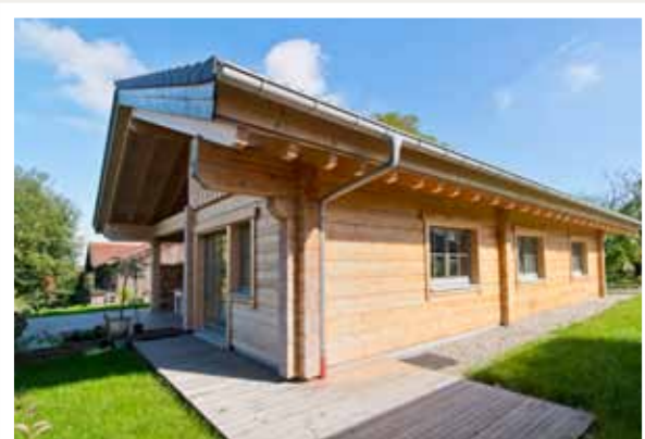
Die Terrasse hat einen überdachten Sitzbereich.