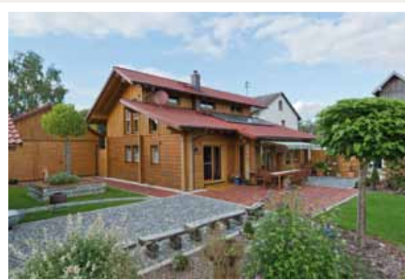
Die markante Dachlandschaft bietet von allen Seiten interessante Ansichten.