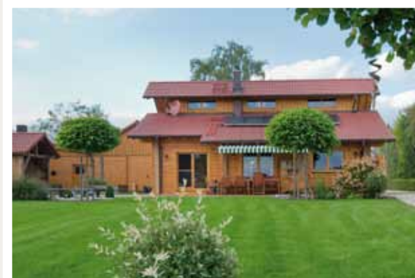
Die schmalen Fenster im Obergeschoss bringen Licht in die offenen Wohnräume im Erdgeschoss.