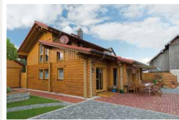
Verschiedene Pflasterarten und -farben geben den Terrassenflächen eine lebendige Struktur.