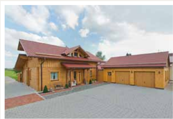
Die Dachgaube und das separate Vordach betonen den zentralen Hauseingang.